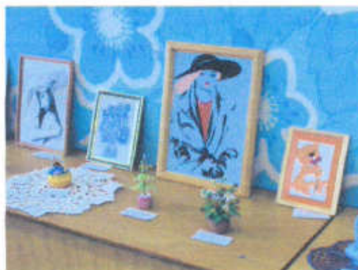
Пресс-клуб НСОШ №2