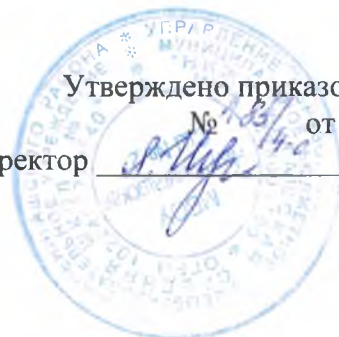
График и режим работы